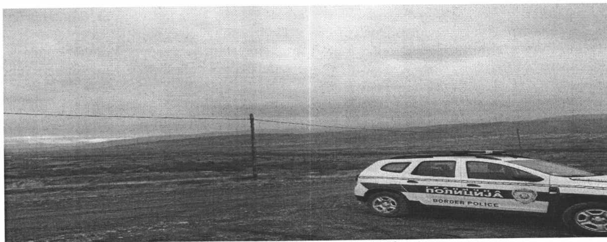
надзор државне границе са Северном Македонијом

Истовремено, добијене су информације да постоје и примери добре праксе, када се породице са децом превозе од границе до прихватних центара и адекватно се збрињавају особе којима је потребна медицинска помоћ.