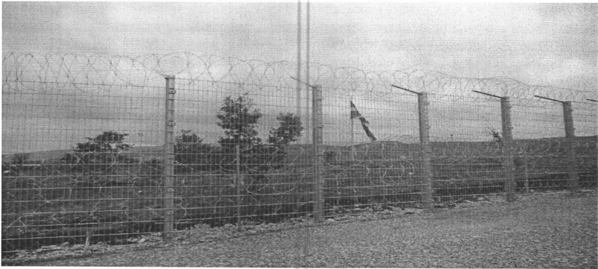
ограда у изградњи на државној граници са Северном Македонијом

На делу државне границе, који је најугроженију у смислу илегалних улазака у земљу, у току је изградња оградe, која би требало у будућности да олакша граничну контролу.