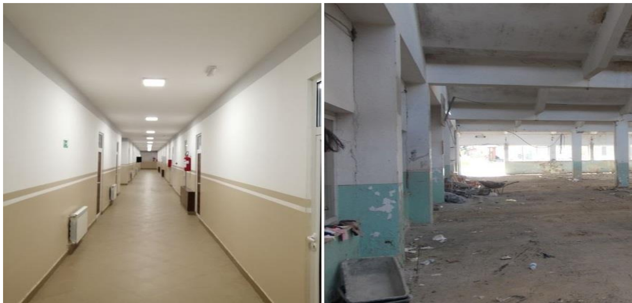
реновирани део објекта за смештај у ЦА Сјеница, затечено стање приликом ове и претходне посете

Центри за азил користе зграде, са вишекреветним собама, за смештај лица која овде бораве. У ЦА Боговаћа, услови се нису битно променили од последње посете НПМ. 6 У ЦА Сјеница, оспособљен је део објекта који приликом претходне посете није био у употреби, а тада је најављено да ће се овај део средити и адаптирати у собе за смештај. 7 Ипак, реновирани део објекта приликом ове посете није био у употреби због мањег броја малолетника у односу на капацитет Центра.