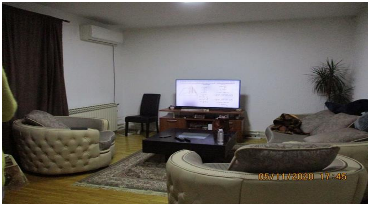
дневни боравак у Кући Спаса

Кућа Спаса поседује заједничке просторије – дневни боравак, трпезарију, дневни боравак, простор за радионице, одвојене тоалете за запослене и кориснике и собе за смештај корисника. Простор је уредан, пријатан, безбедан и на врло високом хигијенском нивоу. Кућа поседује окућницу и мало двориште, као и баштенску кућу опремљену свим неопходним намештајем која се преко дана користи за боравак, радионице и релаксацију. Оброци за кориснике се обезбеђују кетеринг службом. Како је посета НПМ обављена у време ручка, уочено је да се ради о квалитетној нутритивно избалансираној храни.