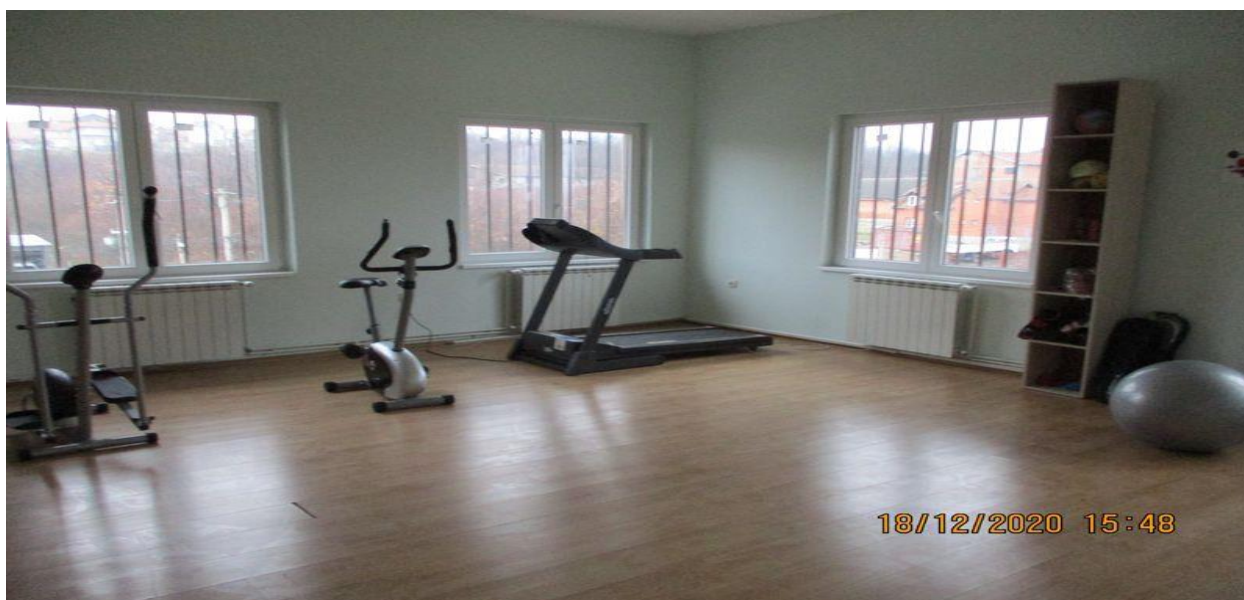
теретана у Центру за смештај малолетних страних лица без пратње родитеља или старатеља

У Центру за смештај малолетних страних лица без пратње родитеља или старатеља Завода за васпитање деце и омладине Београд постоје два одељења – за девојчице и за дечаке, са укупно 6 соба. Собе су задовољавајуће величине, довољно осветљене и загрејане. У собама постоје кревети, гардеробери, столице и мањи столови. Корисници имају на располагању заједничку дневну собу, теретану и информатички кутак. Поред три главна obroка корисницима су обезбеђене и две ужине, појединим данима се припремају у седишту Завода и достављају овде, а појединим у самом Центру.