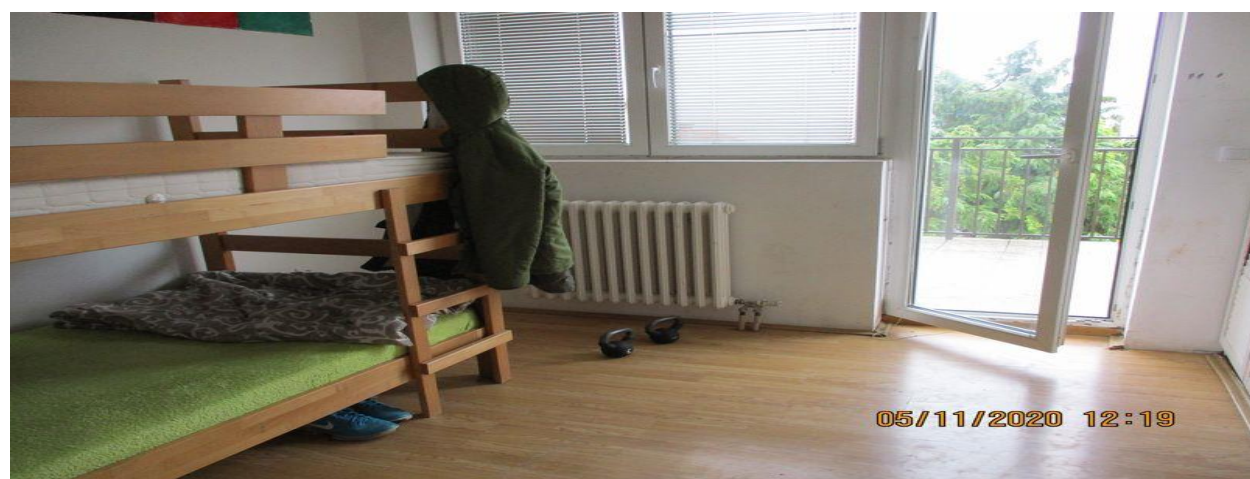
спаваоница у Интеграционој кући

Интеграциона кућа Педро Арупе поседује заједничке просторије – дневни боравак, трпезарију, простор за радионице, информатички кутак опремљен рачунарима, простране собе за смештај корисника и одвојене тоалете за кориснике и запослене. Такође, Кућа је опремљена вешерницом и кухињом у којој кувар припрема нутритивно избалансиране оброке у складу са верским убеђењима корисника и обичајима земље одакле малолетници долазе. Како би добили исхрану која им одговара, нека деца су након смештаја помагала куварици да савлада начин спремања хране према њиховим обичајима. Спрема се пет оброка дневно. Јединице за смештај су комфорне, безбедне и уредне са свим пратећим неопходним намештајем и уређајима. Локација куће је безбедна, а сама кућа поседује и окућницу и двориште погодно за рекреативне активности. У близини куће се налази и игралиште које корисници посећују у пратњи васпитача или самостално када за то постоји договор.