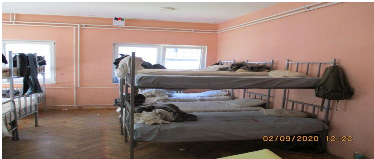
спаваоница у ЦА Боговаћа

Објекти којима управљају невладине организације су куће са двориштем. Собе су претежно двокреветне и услови у њима су изузетно добри.