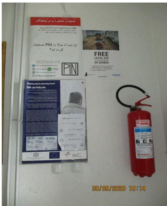
информације о добровољном повратку и азилу у ЦА Сјеница

Корисници, према службеним наводима, бораве око 20 дана у Центру, с тим да постоје случајеви и дужег борава, односно више месеци. Најчешће је реч о већ регистрованим корисницима. У случају да је потребно извршити регистрацију, лица се воде у ПС Сјеница, где се у присуству социјалне раднице обавља регистрација. Центар има капацитет смештаја за 300 особа а у дану посете на смештају су биле 32 особе, од којих 5 пунолетних и сви су мушкарци.