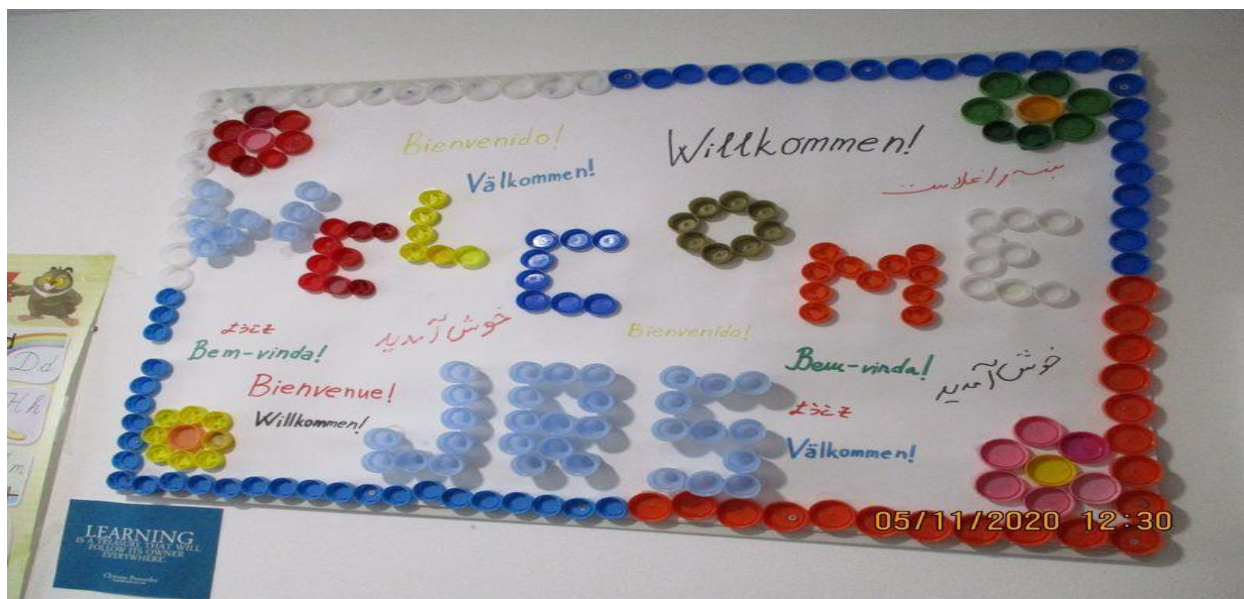
заједничка просторија у Интеграционој кући

Куће и домови за прихват малолетних миграната и избеглица представљају примере добре праксе и веома добро решење када су у питању најрањивије категорије из избегличке и мигрантске популације. Иако се не може очекивати да се овај модел примени на све малолетнике без пратње, због њиховог броја и ограниченог капацитета, потребно је у највећој мери подржати функционисање ове врсте смештаја.