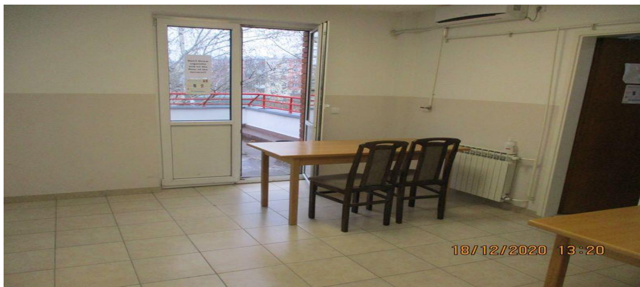
заједничка просторија и тераса у Дому Ј.Ј. Змај

У Центру за смештај малолетних страних лица без пратње родитеља или старатеља Завода за васпитање деце и омладине Београд постоје два одељења – за девојчице и за дечаке, са укупно 6 соба. Собе су задовољавајуће величине, довољно осветљене и загрејане. У собама постоје кревети, гардеробери, столице и мањи столови. Корисници имају на располагању заједничку дневну собу, теретану и информатички кутак. Поред три главна obroка корисницима су обезбеђене и две ужине, појединим данима се припремају у седишту Завода и достављају овде, а појединим у самом Центру.