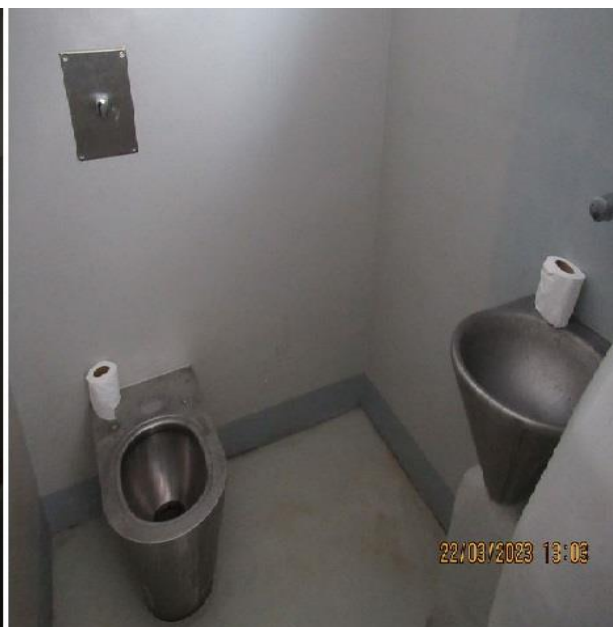
просторија за задржавање у седишту ПУ Шабаци