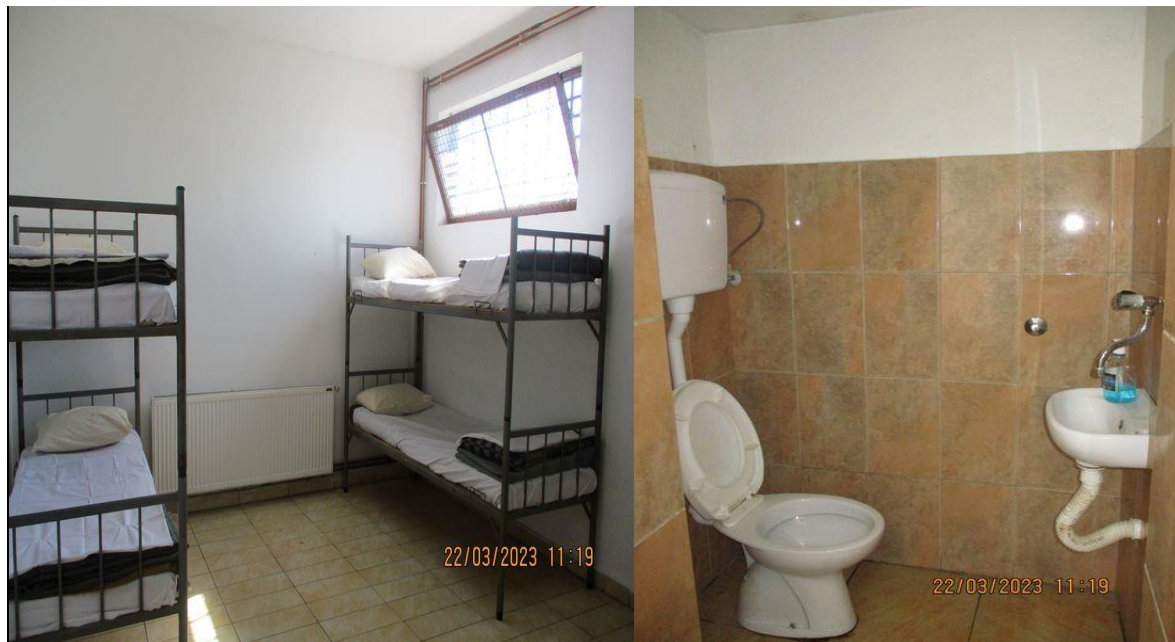
Просторије за задржавање у КПЗ Шабац

Испред објекта се налази простор погодан и за боравак на свежем ваздуху. Прилаз објекту, као и простор испред објекта, покривени су видео надзором.