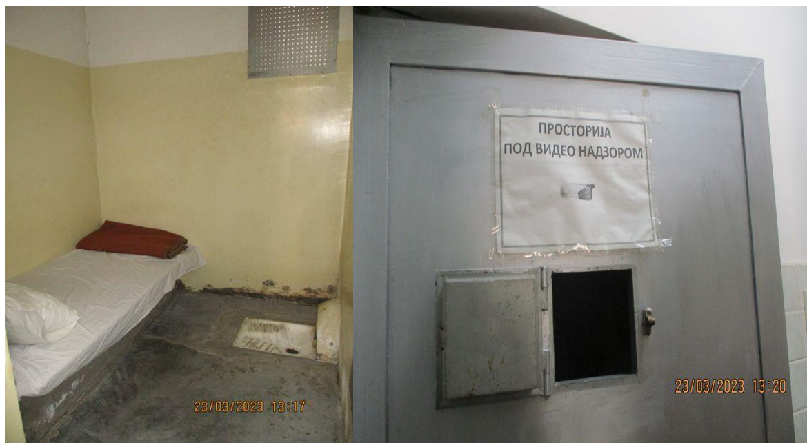
Просторија за задржавање у ПС Љубовија

НПМ би желео да од Министарства унутрашњих послова добије информацију о томе да ли су предузете активности у циљу функционисања видео надзора у ПС Љубовија.