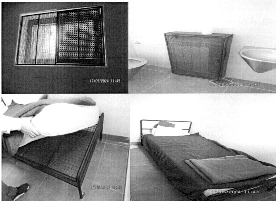
Просторије за задржавање у ПИ Стари град