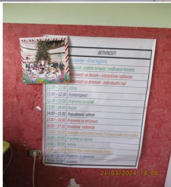
режим и распоред активности у МДЗ