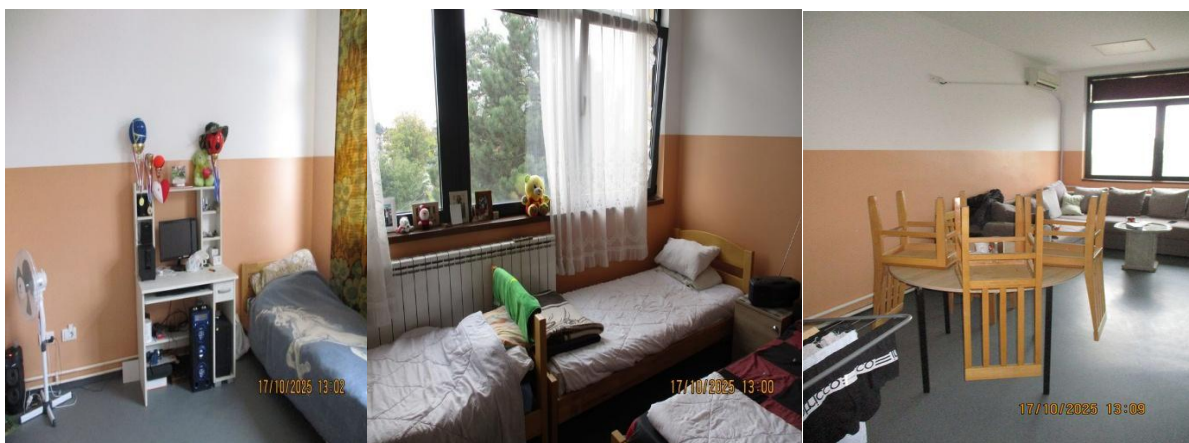
Просторије за осамостаљивање корисника

На истом спрату је и простор за различите врсте радионица и терапија, изгледа веома уредно и одржавано са разноврсним реквизитима.