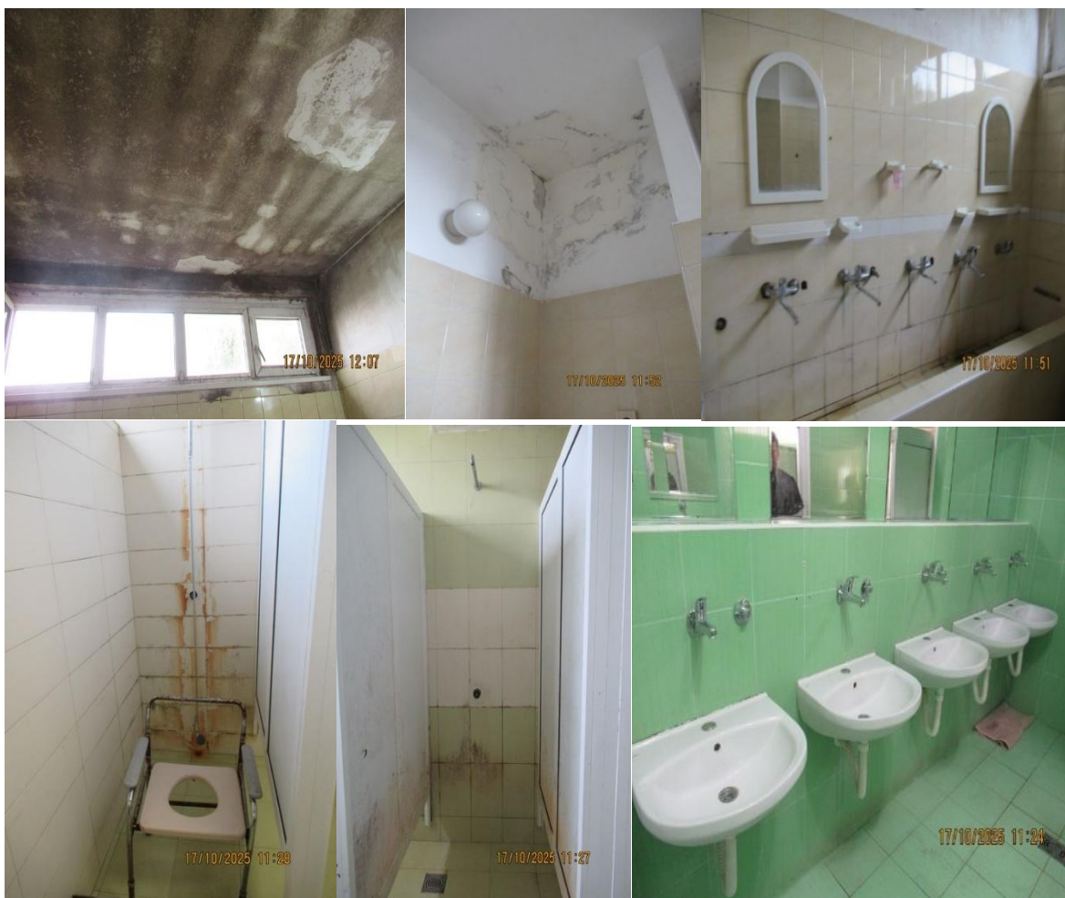
Купатила у Установи

Готово сва купатила у Установи „Сремчица“ су у лошем стању, присутна је влага на зидовима и плафону, оштећене су санитариие и хигијена није на задовољавајућем нивоу.