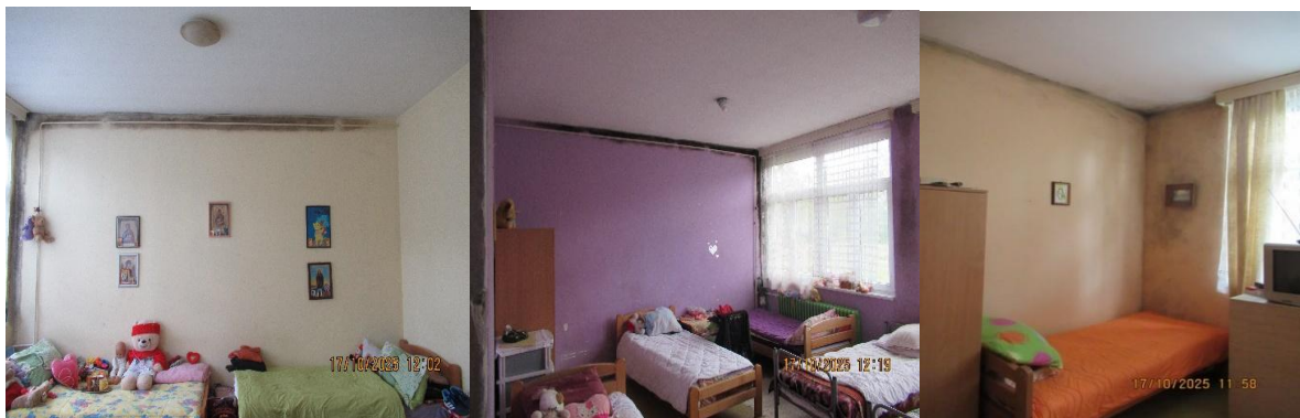
Влага у собама у женском павиљону

Ипак више соба у женском павиљону има влагу на зиду и буђ, са плафона и зидова отпада креч и осећа се непријатан мирис влаге и устајалости.