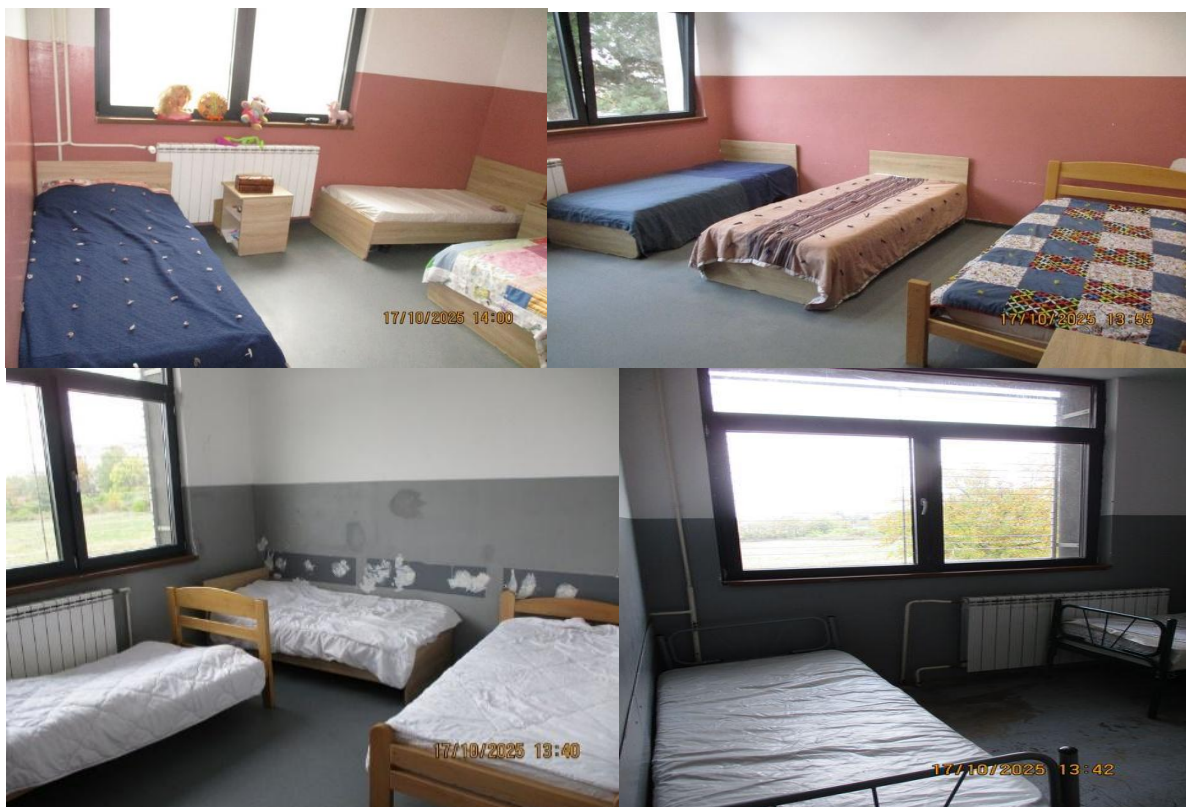
Собе у дечијем павиљону

Собе у павиљону за децу су оскудно опремљене, имају кревете, али ретко која има ормаре, столице, столове, завесе, а хигијена у појединим собама није на задовољавајућем нивоу. Собе нису персонализоване, на зидовима нема слика, фотографија, постера, цртежа, изузев плишаних играчака у појединим собама.