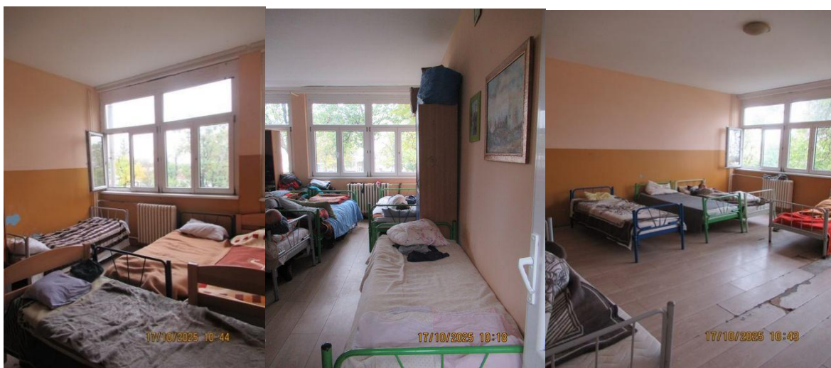
Собе у мушком павиљону

Собе у мушком павиљону су оскудно опремљене, имају кревете, ретко ормаре, столице, столове, изгледају запуштено и хигијена није на задовољавајућем нивоу. Такође, собе нису персонализоване, односно нема комода са личним стварима, у већини соба на зидовима нема слика, фотографија, као ни завеса на прозорима.