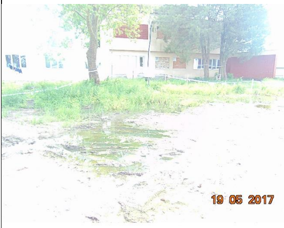
мај 2017. год.

јама које би у потпуности одговориле потребама Центра, да су урађени предрачуни и да се очекује одобравање овог пројекта. Такође, наведено је и да је Програму Уједињених Нација за развој (УНДП) 9 предложена набавка веће цистерне за комунално предузеће из Кикинде. Приликом ове посете, НПМ је добио информације да је одобрен пројекат изградње јама и да је покренут поступак јавне набавке. У дану посете, за разлику од претходног пута, отпадне воде нису биле изливане у дворишту Центра.