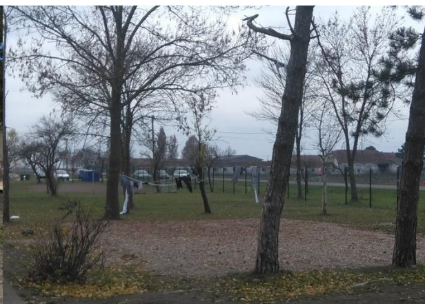
новембар 2017. год

Проблем отпадних вода још увек није решен, али је мање изражен него раније, с обзиром да је мање миграната у Центру. Према наводима службеника Комесаријата, јама мање излива него раније и чешће се празни. У обавештењу Комесаријата о поступању по препоруци 7 је наведено да се са Одељењем Европске комисије за хуманитарну помоћ и цивилну заштиту (ЕЦХО) 8 договара финансирање изградње