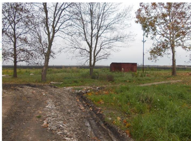
новембар 2017. год