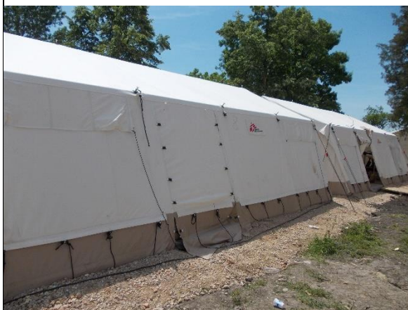
мај 2017. год.

Шатори за смештај који су се налазили у дворишту су склоњени и сви мигранти су сада смештени у згради, а санитарни контејнери су закључани и више се не користе. НППМ је обишао тоалете у згради и утврдио да су они чисти и одржавани.