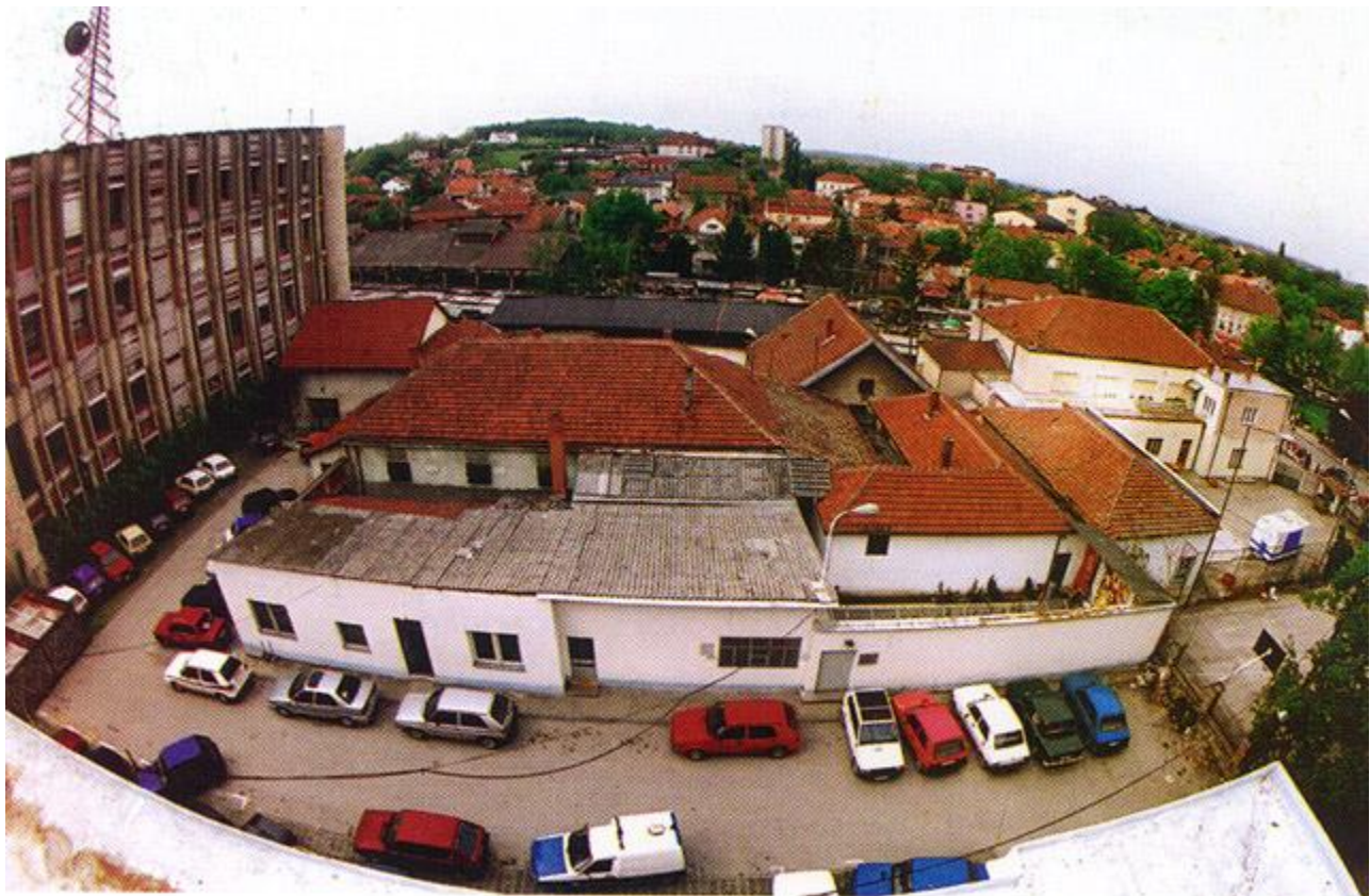
ОКРУЖНИ ЗАТВОР У КРУШЕВЦУ (слика преузета са сајта Управе за извршење кривичних санкција)