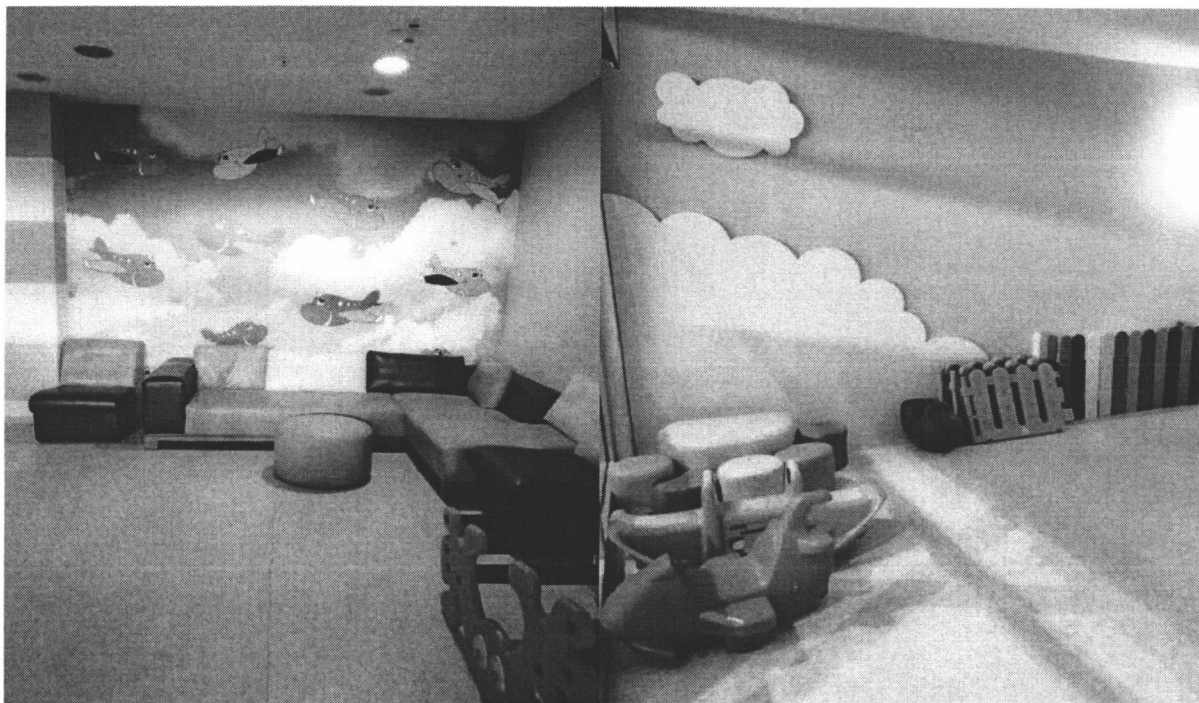
просторија за мајке са децом у транзитној зони Аеродрома

Странцима који не испуњавају услове за улазак, а затраже азил, Станица граничне полиције на Аеродрому „Никола Тесла“ издаје потврде о регистрацији. Такође, према речима полицијских службеника, уколико странац у разговору са њима изјави да страхује за своју безбедност и живот уколико буде враћен у државу полазне дестинације, и ако постоје оправдани разлози за тај страх, не враћа се у земљу из које је дошао већ се према њему поступа као да је тражио азил. Током 2019. године ни према једном лицу нису употребљене мере принуде.